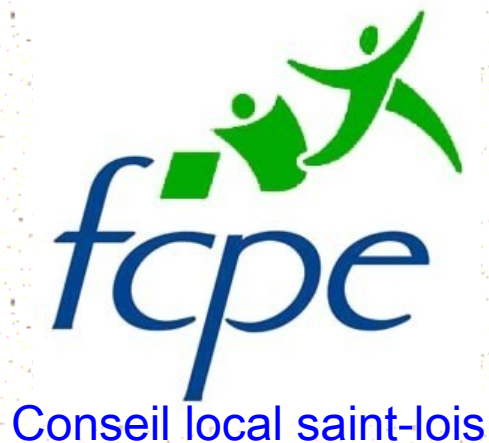
Table ronde Mercredi 20 mai 2015 à 20h